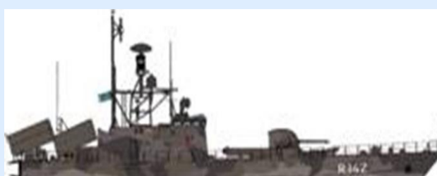
Föreningen Svenska Robotbåtar, FSvR